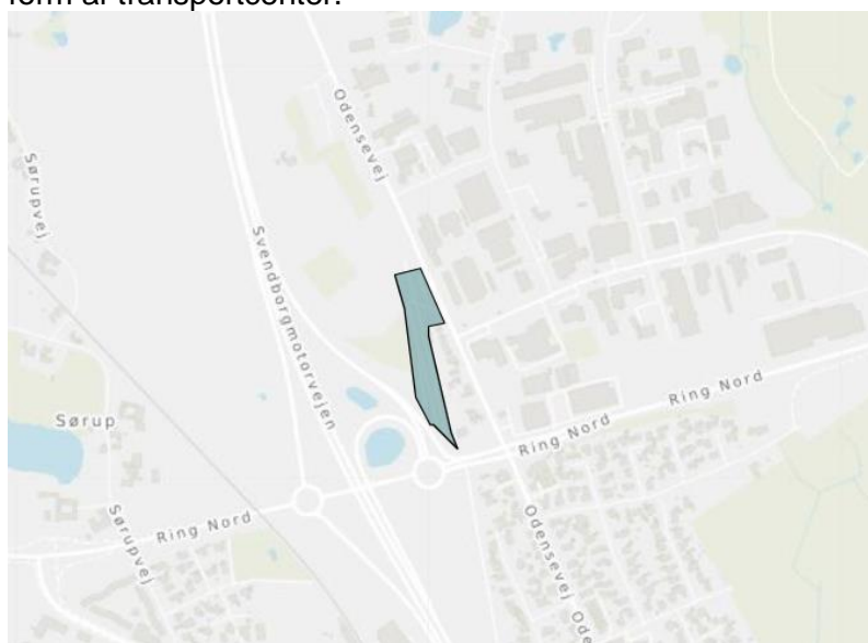
Rammeområde 03.01.T1.439 - Tekniske anlæg Transportcenter

Der er i dag udlagt et mindre areal, indenfor område 2, til tekniske anlæg i form af transportcenter.