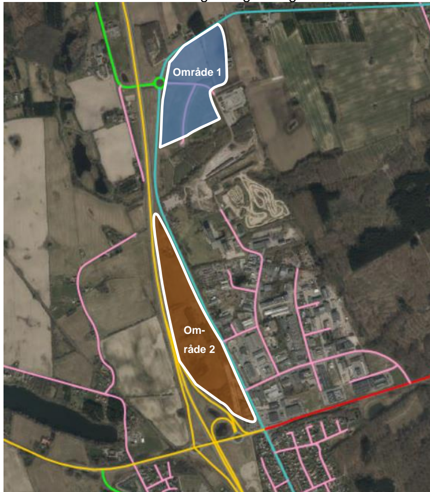
Luftfoto fra 2021, den gule linje viser den nutidige (2021) linjeføringen for statsveje herunder Svendborgmotorvejen.

Der er i forbindelse med revision af kommuneplanen ønske om at udvide genbrugsstationen. En udvidelse af genbrugsstationen kræver at den placeres i tilknytning til den eksisterende genbrugsstation. Det betyder at en mindre del af område 1 inddrages til genbrugsstation.