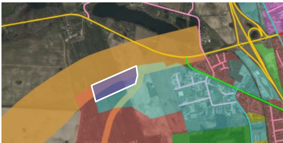
Det lille område med hvid streg, viser det nye udlæg til transport- og logistikerhverv samt transporttunge virksomheder.

For ikke at skabe gener til de kommende boligområderne ved Tankefuld skal der skabes en glidende overgang til det blandende bolig- og erhvervsområde i Tankefuld. Rundt om erhvervsområdet til transport- og logistikvirksomheder, skal der i forbindelse med nærmere planlægning undersøges behovet for støjdæmpende foranstaltninger, både i forbindelse med de enkelte virksomheder og for området som helhed.