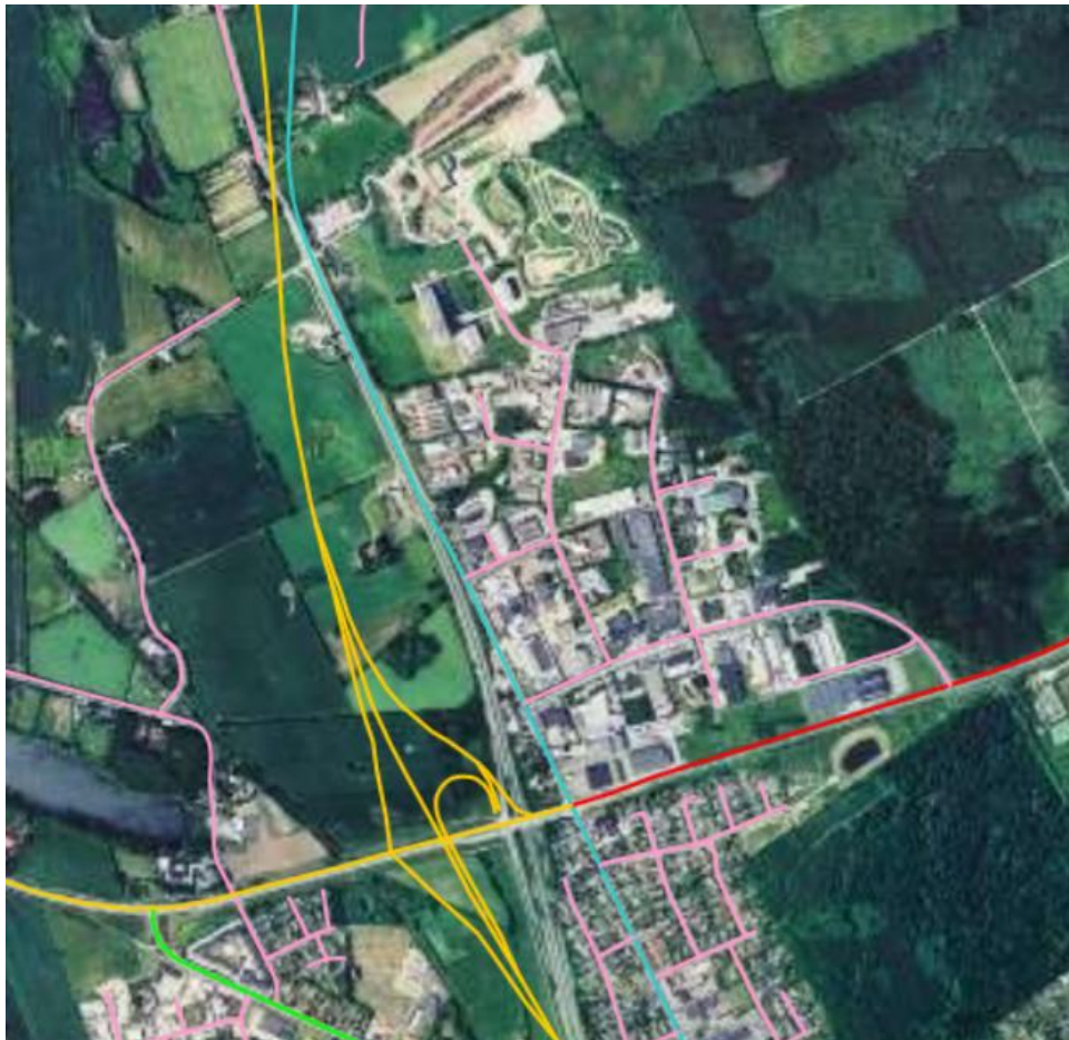
Luftfoto fra 2002, den gule linje viser den nutidige (2021) linjeføringen for statsveje herunder Svendborgmotorvejen.

Svendborgmotorvejen er en opgraderingen af den daværende hovedvej mellem Odense og Svendborg.